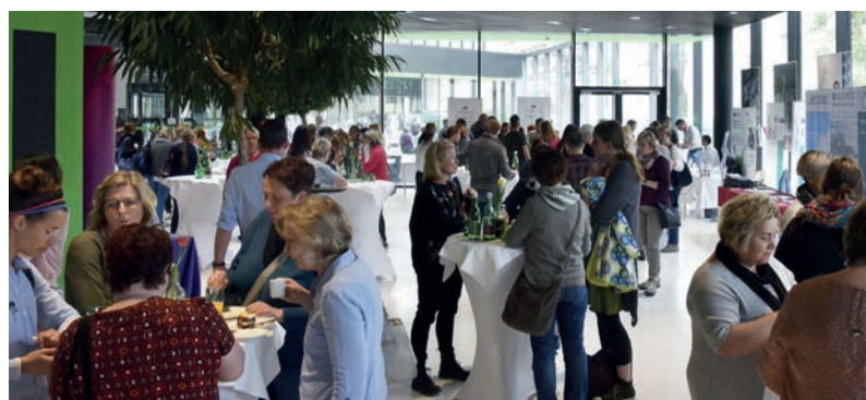
Alle Bilder aus früheren Veranstaltungen